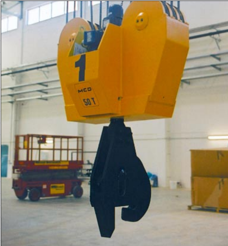
Unterflasche in Nenngröße 16 und Triebwerkgruppe 2m